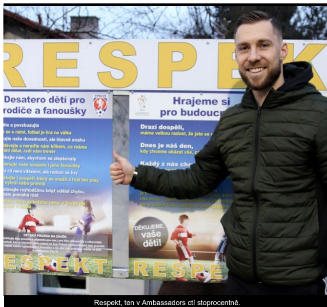
Respekt, ten v Ambassadors cíl stoprocentně.